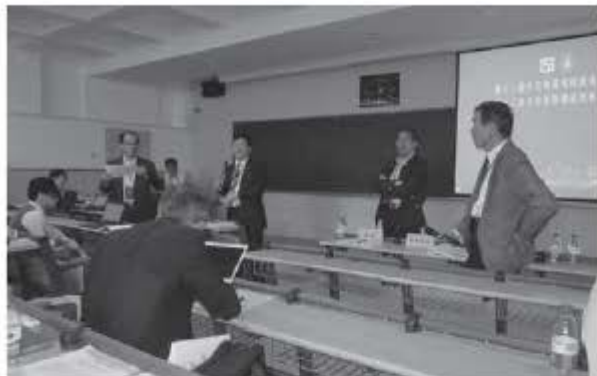
写真6 專題討論会風景

第1会場の学術発表のテーマは構造技術者の役割とあり方、日中両国の設計基準、工業化構工法の開発・設計・施工、設計・施工における BIM の活用、構造ヘルスマonitoring と損傷評価である。日本側から高強度鉄筋 PRC 構造の紹介、日中鋼構造設計規準の比較研究、ドリフト硬化型柱を有する RC ピロティの地震応答性状、CLT パネルと鉄骨のハイブ