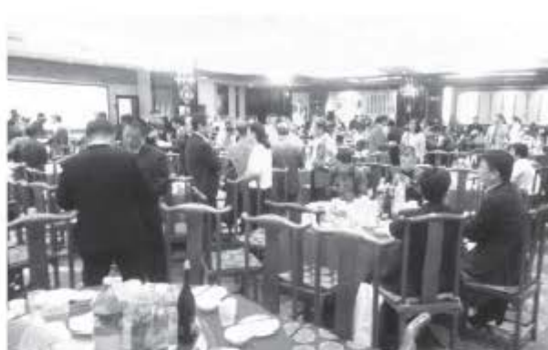
写真9 日中共同歓迎宴会

第十三回交流会は久々の中国開催ではあったが、JSCA本部を始め、関係の方々の協力を仰ぎながら準備を進めた。企画運営した交流会運営幹事会も新しいメンバーを迎え、準備