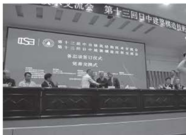
写真8 覚書への署名