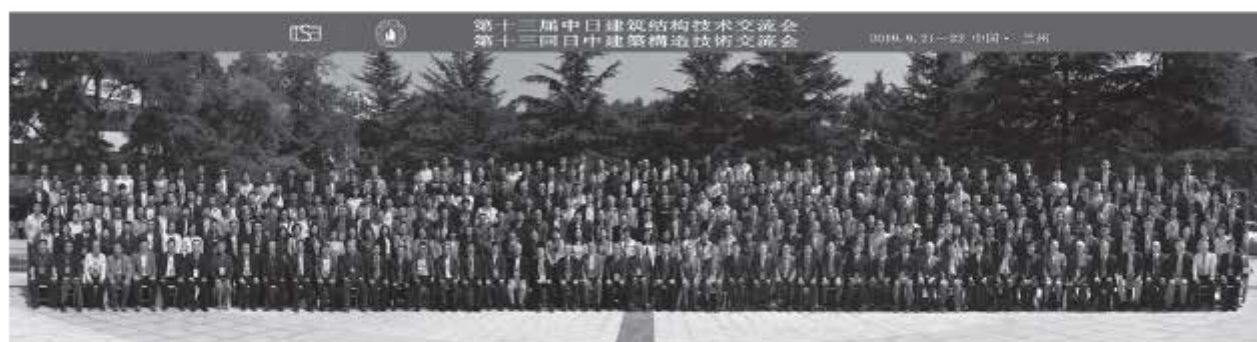
写真1 全体集合写真

第九回から日本と中国の双方で開催することとなり、第九回（日本大学）、第十二回（神戸大学）は日本で開催された。また2015年3月には、阪神淡路大震災から20年目であることを踏まえ、東京理科大学神楽坂キャンパスで「建築構造日中国際ワークショップ」を開催し、阪神淡路大震災あるいは四川大地震以降の日中双方の耐震設計・耐震技術の発展に関する討論会を行っている。日中建築構造技術交流会の沿革および第九～十二回交流会、さらにワークショップの概要については、いずれもstructureに報告している 1)~4) 。