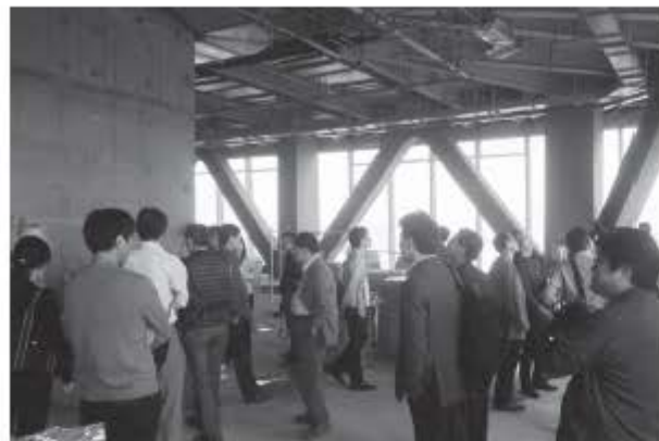
写真2 現場見学風景

第十三回交流会は、会議前日(20日)に蘭州市の二か所の建設現場(免震、超高層)の見学会からスタートした。交流会参加者は、19日夕方に羽田空港出発組とその他経由組が上海で合流して国内線で蘭州に入りホテル(蘭州市飛天大酒店)に投宿した。翌朝20日に同ホテルから専用バスにて移動した。