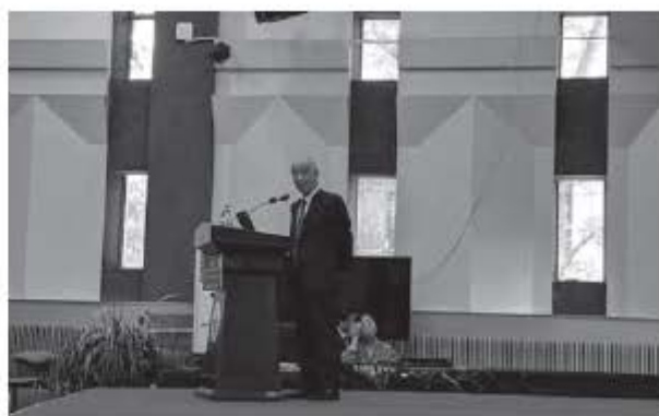
写真4 和田章名誉教授(東京工業大学)の基調講演