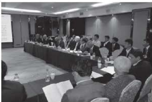
写真7 日中合同役員会

リット構造のオフィス事例、ロール成形角形鋼管の繰返し荷重による座屈挙動、強震記録の分析と建物上の鉄塔の減衰性能の研究、2016 年熊本地震による RC 庁舎の杭基礎損傷調査に関する論文が発表された。